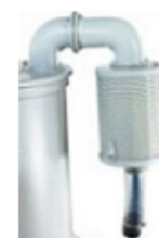
HDC - kolektor antypyłowy