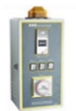
T - rozszerzony timer