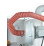
HRC - obieg gorącego powietrza