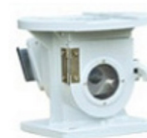
M - podstawa magnetyczna