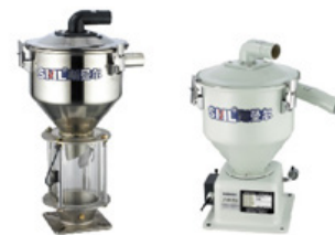
Podajnik "electric eye"